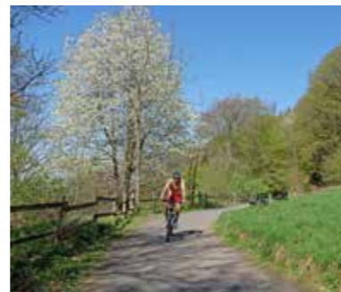
Fotos: Siegfried Krenz / Berggarten Petersberg / Drei-Seen-Blick / Radfahrer Löwenburg alle © Tourismus Siebengebirge