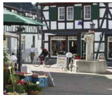
Fotos: Marienkapelle Rhöndorf / Aalschöcker Anika / Fechwerkhäuser Innenstadt