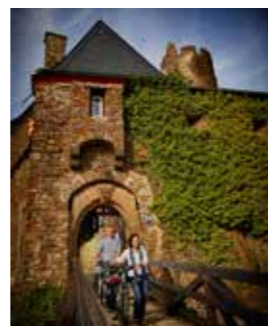
Fotos: Moselsteig, Koblenz-Gondort / Bug Thurant