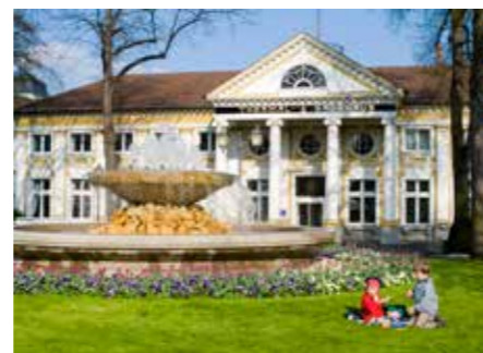
Fotos: Rotweinwanderweg / Historisches Ahrweiler / Thermal-Badehaus